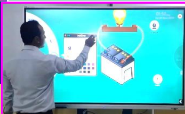
DIGITAL CLASS ROOM